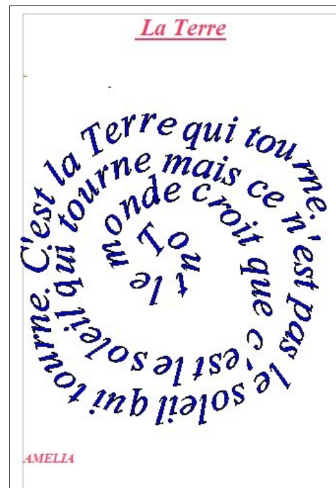
Production d'un élève de CE1/CE2